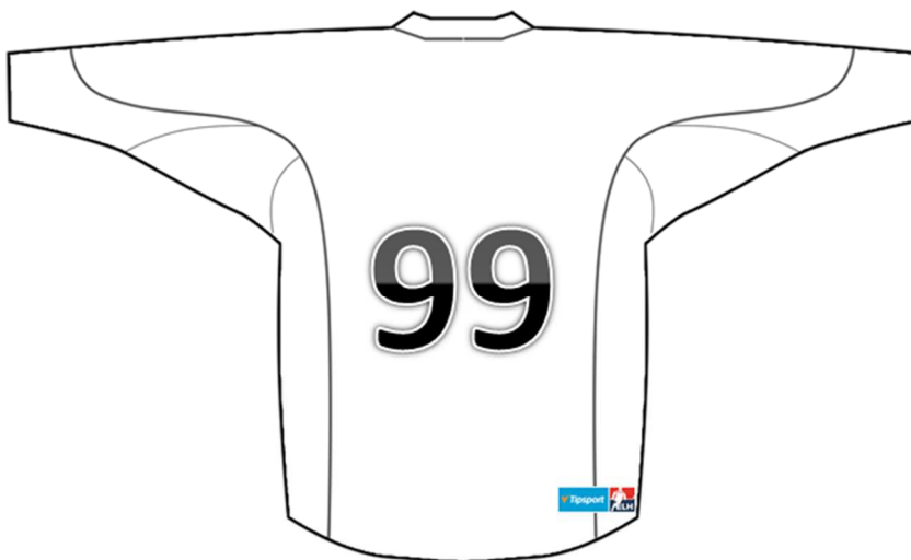
Náhled umístění loga Tipsport ELH na zadní straně dresu

5.9. Kluby jsou pro účely utkání Tipsport ELH povinny umístit na pravou spodní část zadní strany dresu logo Tipsport ELH o velikosti 10x3,5 cm.